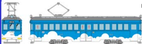
■ 阪堺電車モ161形 164号車 雲形ブルー / 2,200円(税抜)