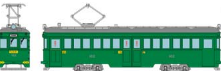
■ 阪堺電車モ161形 162号車 グリーン / 2,200円(税抜)