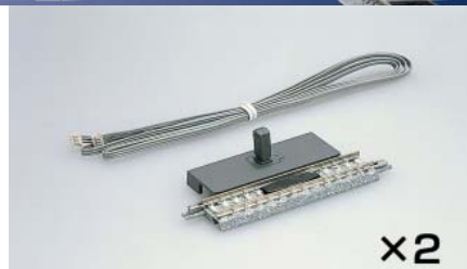
<5573> TCSセンサーPCレールS70-PC(F)(2本セット)