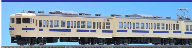
<98266> JR 115-2000系近郊電車(瀬戸内色)セット(4両)