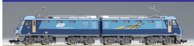
<9180> JR EH200形電気機関車