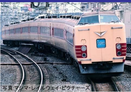
写真マシマレイルウェイピクチャーズ