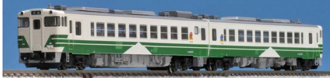
<98034> JR キハ48-500形ディーゼルカー(更新車・男鹿線)セット(2両) <9416> JRディーゼルカー キハ40-500形(男鹿線)(M) <9417> JRディーゼルカー キハ40-500形(更新車・男鹿線)(T)