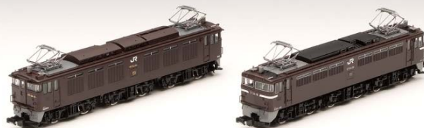
<98977> 限定品 JR EF64形電気機関車(41号機・茶色) ・EF65形電気機関車(56号機・茶色)セット