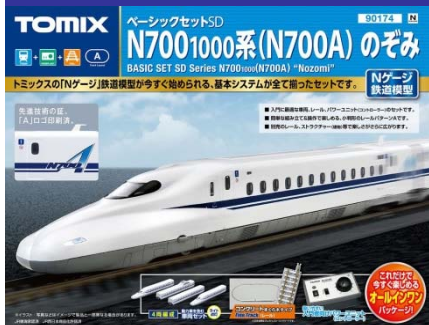
<90174> ベーシックセットSD N700-1000系(N700A)のぞみ