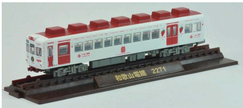
対象車両:いちご電車2271(番号210) ※

鉄道コレクション「和歌山電鐵いちご電車2270系 2両セット」「和歌山電鐵たま電車2270系 2両セット」におきまして、無線アンテナのおまけパーツが各1点付属します。取付対象車両はパンタ無しの車両になります。以下ご参照の上、お好みで取り付けてください。