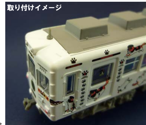
※ お好みで無線アンテナ パーツは着色してください。