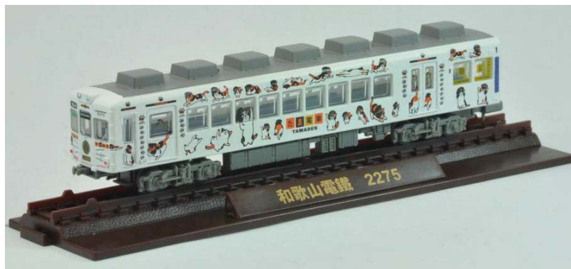
対象車両:たま電車2275(番号212) ※