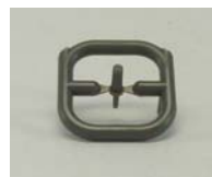
←付属するアンテナ 各1点付属します。