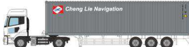
⑥UDトラックスクオン CNC Line (40ft 背高コンテナ)