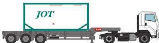
⑦いすゞギガ 日本石油輸送 (ISO タンクコンテナ)