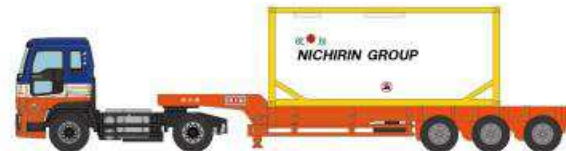
④いすゞギガ 日輪 (ISO タンクコンテナ)