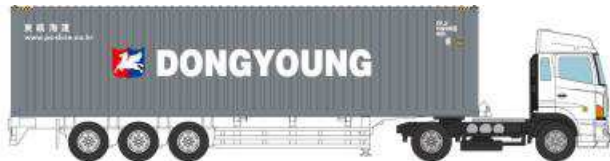
①日野プロフィア 東暎海運 (40ft 背高コンテナ)