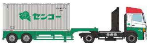
⑨日野プロフィア センコー (20ft バルクコンテナ)