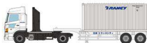
⑧日野プロフィア 日本トランスシティ (20ft バルクコンテナ)