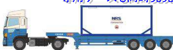
②日野プロフィア 日陸 (ISO タンクコンテナ)