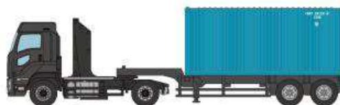
⑩いすゞギガ (20ft バルクコンテナ)