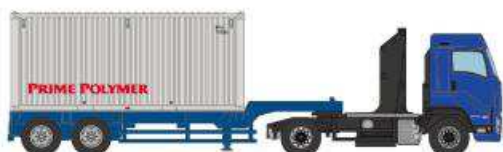
⑤いすゞギガ プライムポリマー (20ft バルクコンテナ)