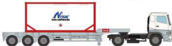
③三菱ふそうスーパーグレート ニヤクコーポレーション (ISO タンクコンテナ)