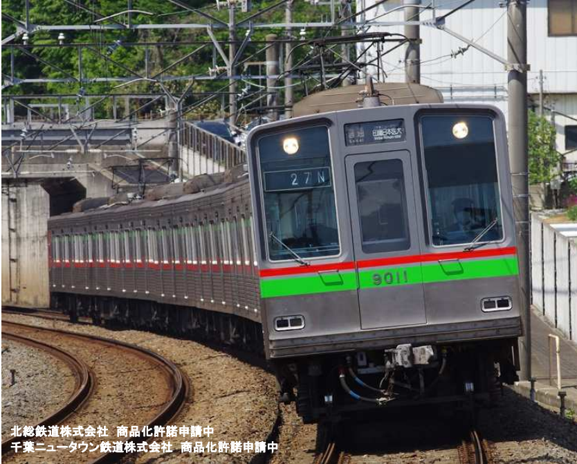
北総鉄道株式会社 商品化許諾申請中 千葉ニュータウン鉄道株式会社 商品化許諾申請中