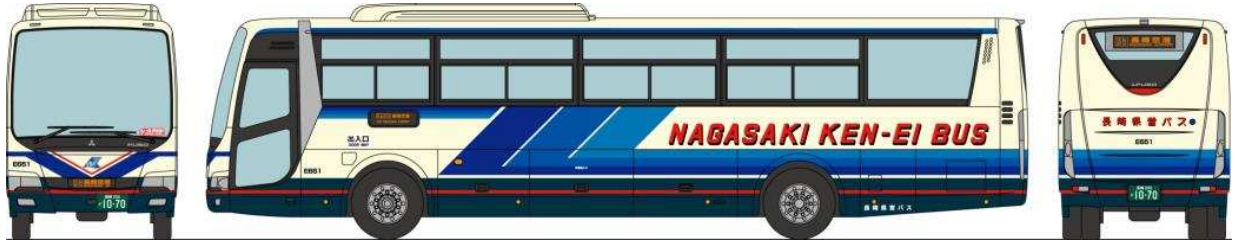
①長崎県営バス 三菱ふそうエアロエース QTG-MS96VP 長崎空港リムジンバス 浦上・長崎バイパス経由 長崎空港行