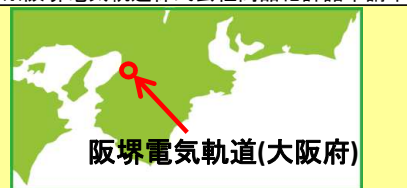
阪堺電気軌道(大阪府)

動力ユニット 大型路面電車用 TM-TR04 ※パンタグラフ・走行用パーツには対応していません 本体パッケージサイズ(予定) H65×W170×D40(mm)