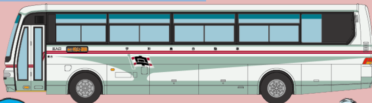
宇和島自動車 三菱ふそうエアロバス

高知西南交通は四万十市を中心に高知県西南地域を運行しています。 番組内では2日目、佐賀駅(高知県)から入野駅経由中村駅行に乗車、中村駅で下車しました。 高知県内ではよく見かける右側面に非常口がないタイプのリエッセです。