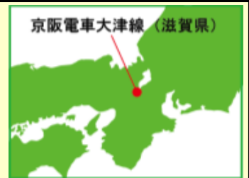
京阪電車大津線(滋賀県)

動力ユニットはTM-20(15m級C)、走行用パーツセットはTT-04R、パンタグラフはPG16<0238>を推奨しています。