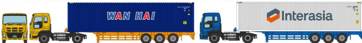
③いすゞギガ+ワンハイラインズ (40ft 背高ドライコンテナ)