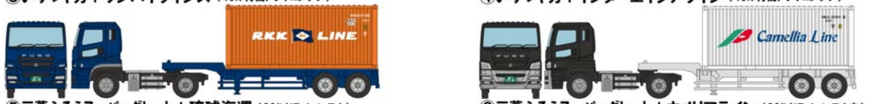
⑤三菱ふそうスーパーグレート+琉球海運 (20ft ドライコンテナ)