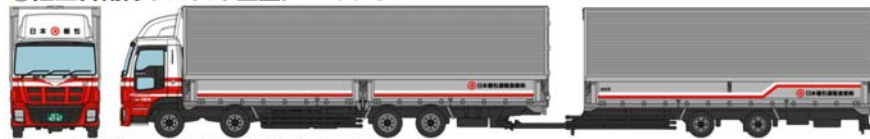
⑩いすゞギガ+日本梱包運輸倉庫フルトレーラー