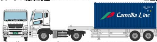
⑦三菱ふそうスーパーグレート+カメリアライン (20ft ドライコンテナ紺)