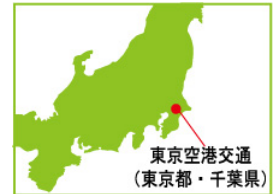
東京空港交通 (東京都・千葉県)

首都圏の成田空港・羽田空港と関東各地を結ぶリムジンバスを多数運転する他に、両空港内のランプ内バスやクルーバスなどを運行しております。